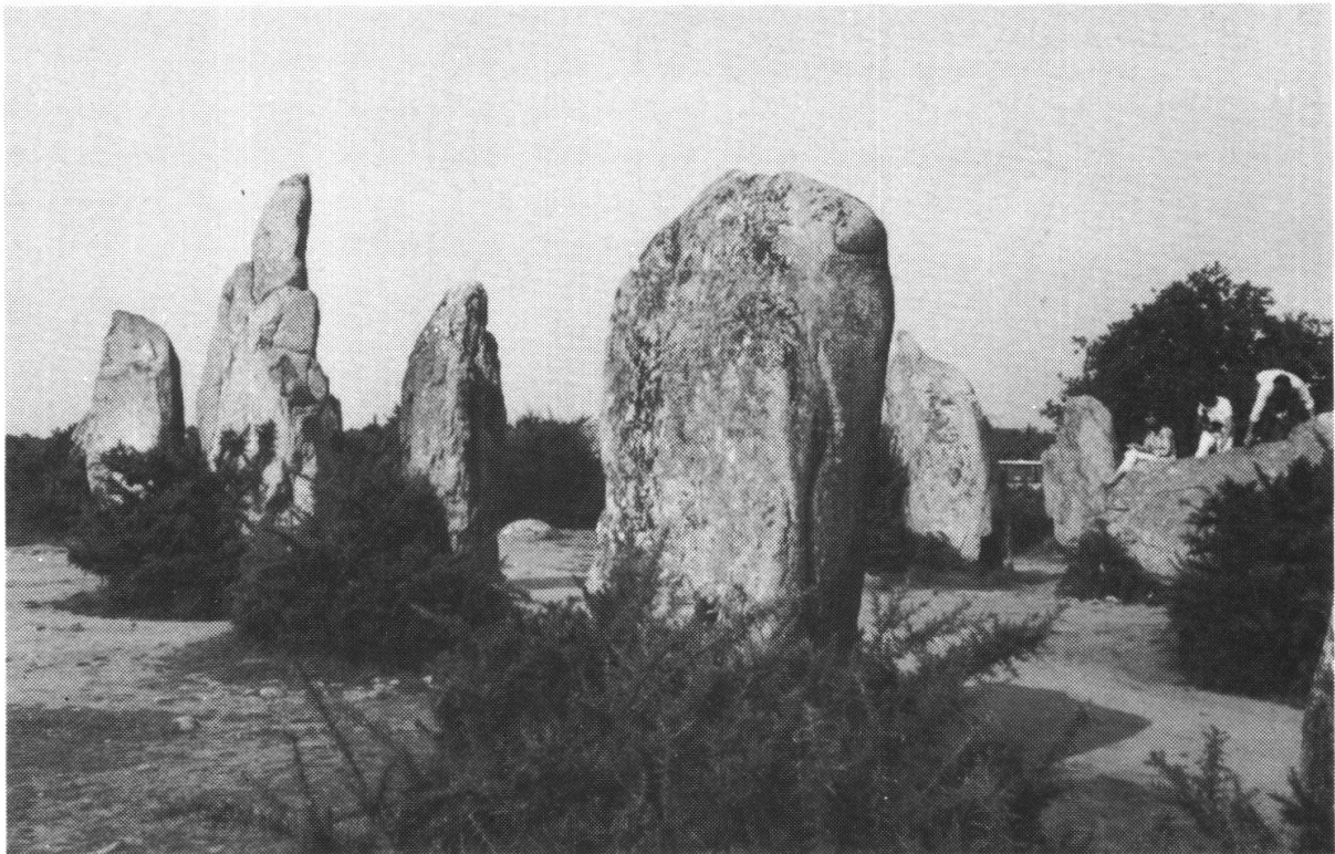
Einige der bis über 100 Tonnen schweren, in Reihen angeordneten 1029 Menhire («Langer Stein») von Kermario bei Carnac, Bretagne; Alter ca 5000 Jahre