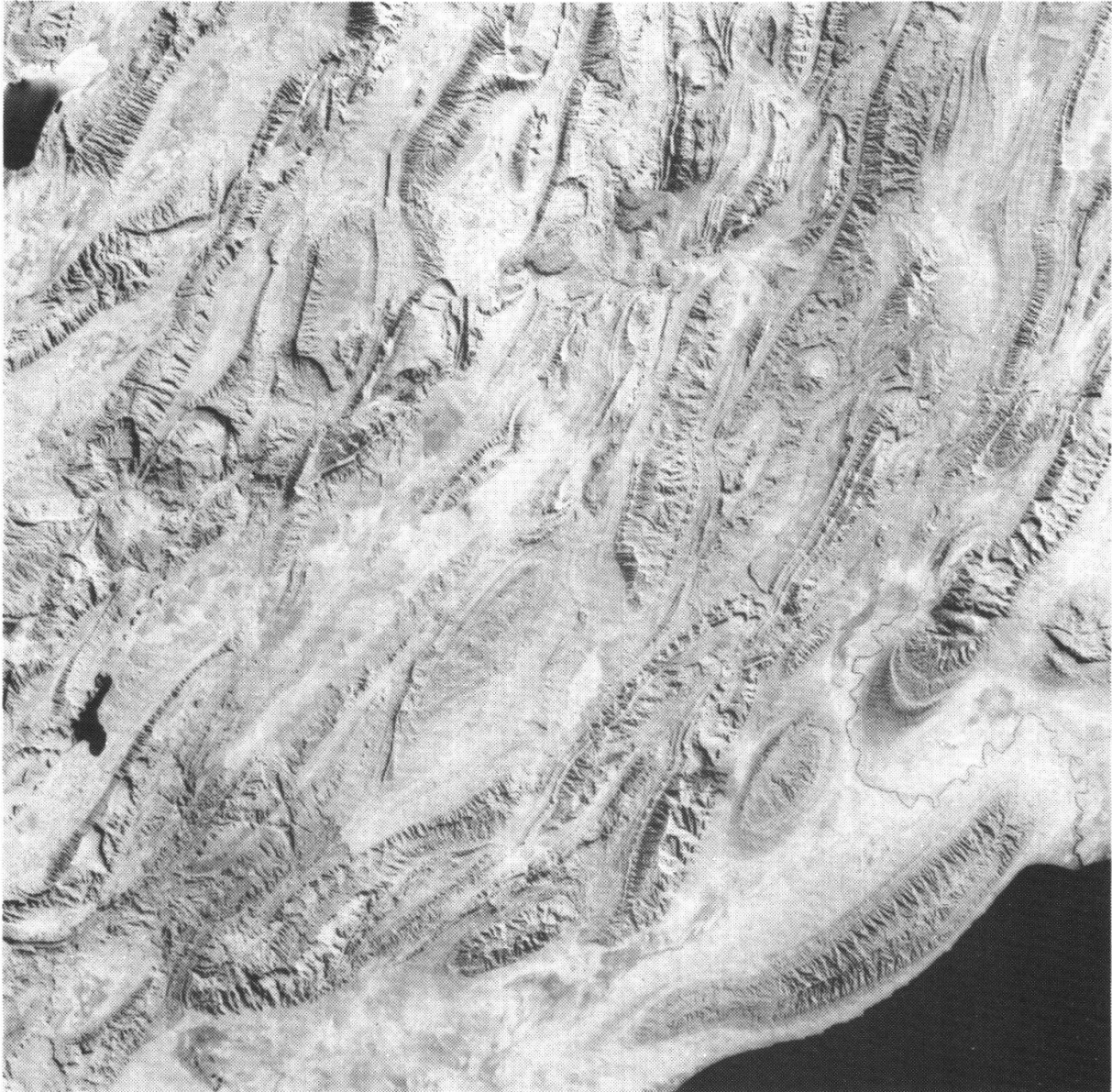
Figure 3: Image Landsat des montagnes Zagros (Iran), prise le 20 novembre 1976, scène de 185 * 185 km, résolution spatiale 80 * 80 m, bande infrarouges (7).