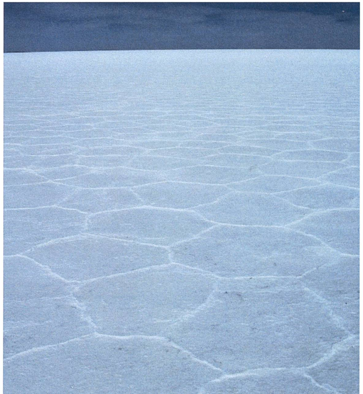
Abbildung 2. Salzkruste des Salar de Uyuni, Bolivien.

Der besondere Wert der Geographie im MINT-Konglomerat ist zweifach: Erstens zeigt die Geographie durch den integralen und problembezogenen Ansatz die Bedeutung von Sozial- und Naturwissenschaften und damit auch die Relevanz von MINT-Themen auf. Die aktuelle Bedeutung der MINT-Fächer wird den Lernenden dadurch in einem umfassenden Sinn immer wieder verdeutlicht. Zweitens können dank der Integrationsfunktion der Geographie bezüglich Natur- und Sozialwissenschaften auch sozialwissen-