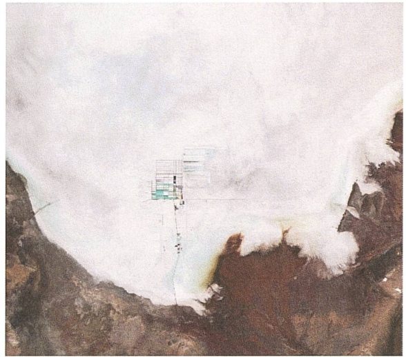
Abbildung 1. Lithiumabbau, Salar de Uyuni, Bolivien (Satellitenbild, NASA, 7. Jan. 2019).

Exakte Zahlen über das dortige Lithiumvorkommen liegen nicht vor. Sie schwanken je nach Quelle beträchtlich. Gemäss Schätzungen entsprechen die Lithiumvorkommen in Bolivien 13.6 – 18.3% der weltweit bekannten Vorräte (Deutsche Rohstoffagentur DERA, 2017). Ist Bolivien damit das Saudi-Arabien des 21. Jahrhunderts? Denn Lithium, das leichteste aller Metalle, ist heute ein zentraler Bestandteil wiederaufladbarer Akkus für digitale Geräte wie mobile Telefone und Computer, vor allem aber auch für Elektrofahrzeuge. Billigere Alternativen wie Natrium-