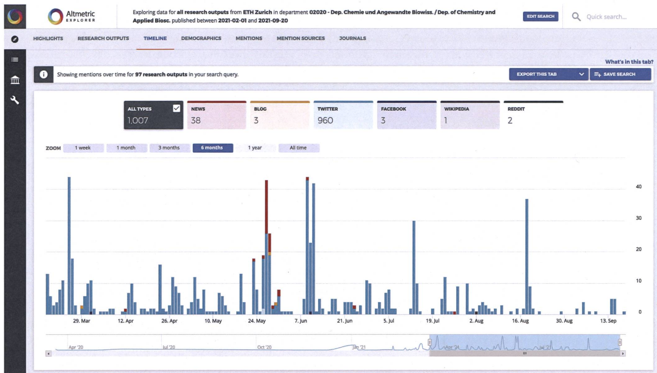
Abbildung 9. Dashboard von Altmeteric, der Institutional Explorer. Gezeigt sind die Erwähnungen aller 2021 erschienenen Publikationen unseres Departements Chemie und Angewandte Biowissenschaften.

marizes academic articles for you: Reducing reading time to 3 minutes!» 21 , und auch RAX, welches sich als «A smart research assistant that provides a connected workflow for researchers, and helps speed up exploration, organization, analysis, and comprehension of literature» empfiehlt. 22