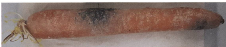
Abbildung 2. Karotte mit Thielaviopsis basicola (Erreger der Schwarzen Wurzelfäule).

In der Produktion von Gemüse und Früchten ist die Biokonservierung durch den Einsatz nützlicher