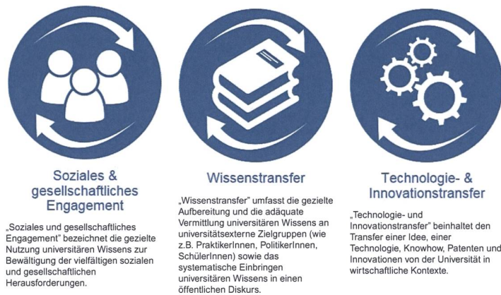
Abb. 2. Die drei Dimensionen der Third Mission an der Universität Wien