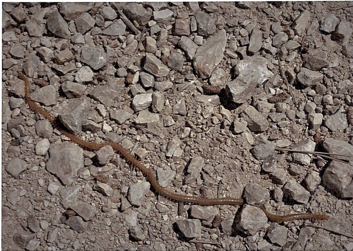
Abb. 1. Wie stellen wir es an, uns in einen Tausendfüßler einzufühlen?