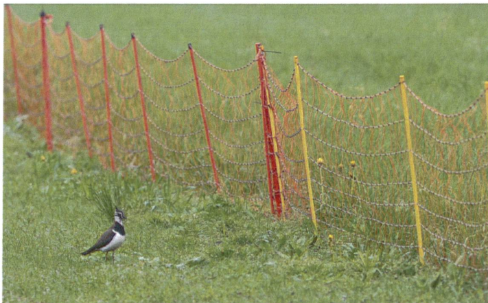
Abb. 5. Dank guter Zusammenarbeit mit den lokalen Bauern bzw. aufwändigen Schutzzäunen und weiteren Massnahmen gelang es, den Kiebitzbestand in der Wauwiler Ebene wieder zu erhöhen.

Mit zunehmendem Wissen konnten laufend bessere Schutzmassnahmen umgesetzt werden. Als erstes galt es, eine enge Zusammenarbeit mit den lokalen Landwirten aufzubauen. Erfreulich war, dass die Landwirte bereit waren, bei den Feldarbeiten Rücksicht auf die Gelege zu nehmen und sie zu umfahren. Dies erforderte aber einen grossen personellen Aufwand zum Suchen der Gelege und gut eingespielte Informationswege. Diese Rücksicht nützte jedoch nichts, wenn die Gelege in der Nacht trotzdem ausgeraubt wurden. Man begann deshalb, die Gelege mit Elektrozäunen zu schützen. Zu Beginn wurde der Zaun so aufgestellt, dass eine Fläche von rund 10 auf 10 Metern geschützt war, ging dann aber bald dazu über, das ganze Feld mit mehreren Kiebitzpaaren abzuzäunen. Im Rahmen des lokalen Vernetzungsprojektes minderten neu geschaffene Flachteiche und Tümpel den Nahrungsmangel. Hier konnten die jungen Kiebitze auch bei trockener Witterung noch Kleingetier finden.