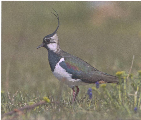
Abb. 4. Der Kiebitz ist dank der einzigartigen, langen Federholle und dem violetten Glanz der dunklen Gefiederpartien unverkennbar.

Mit zunehmendem Wissen konnten laufend bessere Schutzmassnahmen umgesetzt werden. Als erstes galt es, eine enge Zusammenarbeit mit den lokalen Landwirten aufzubauen. Erfreulich war, dass die Landwirte bereit waren, bei den Feldarbeiten Rücksicht auf die Gelege zu nehmen und sie zu umfahren. Dies erforderte aber einen grossen personellen Aufwand zum Suchen der Gelege und gut eingespielte Informationswege. Diese Rücksicht nützte jedoch nichts, wenn die Gelege in der Nacht trotzdem ausgeraubt wurden. Man begann deshalb, die Gelege mit Elektrozäunen zu schützen. Zu Beginn wurde der Zaun so aufgestellt, dass eine Fläche von rund 10 auf 10 Metern geschützt war, ging dann aber bald dazu über, das ganze Feld mit mehreren Kiebitzpaaren abzuzäunen. Im Rahmen des lokalen Vernetzungsprojektes minderten neu geschaffene Flachteiche und Tümpel den Nahrungsmangel. Hier konnten die jungen Kiebitze auch bei trockener Witterung noch Kleingetier finden.