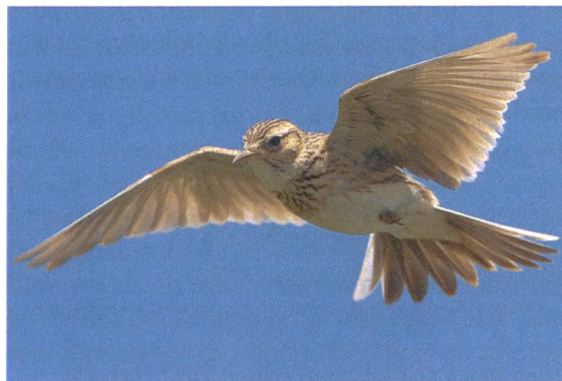
Abb. 1. Der Gesang der Feldlerche aus dem blauen Himmel gehörte lange Zeit untrennbar zur Kulturlandschaft. In den letzten Jahren ist die Feldlerche immer seltener geworden und vor allem in den Grünlandgebieten des östlichen Mittellandes fehlt sie mittlerweile auf grossen Flächen vollständig.

Wie in grossen Teilen Europas ist auch in der Schweiz die Biodiversität im Kulturland besonders stark unter Druck (siehe Abb. 1, Lachat et al. 2010). Für die Gruppe der Vögel zeigt das der Swiss Bird Index besonders drastisch auf (Sattler et al. 2017). Dieser Index bildet, ähnlich wie ein Börsenindex, die Entwicklung der Brutvögel ab und kann auch gruppenspezifisch berechnet werden. Während der Index der Siedlungs-, Berg- und Feuchtgebietsarten keinen klaren Trend