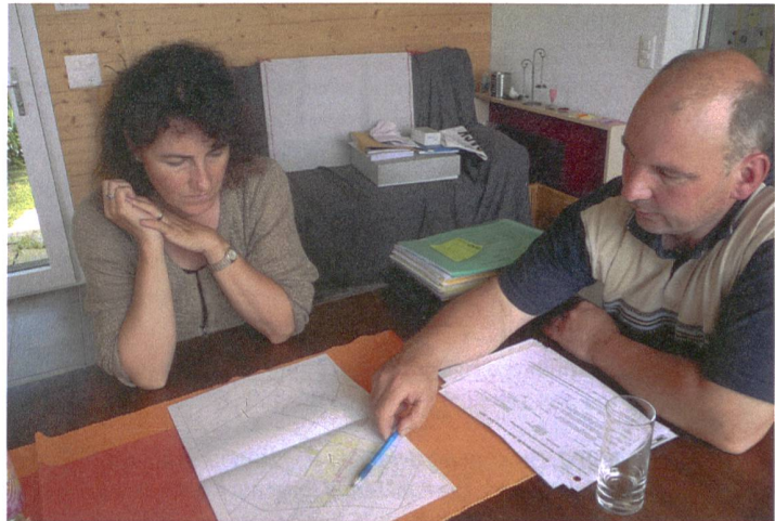
Abb. 6. Eine gesamtbetriebliche Beratung führt oft zu verbesserten Biodiversitätsleistungen sowie zu einer Veränderung der Einstellung des Landwirtes gegenüber ökologischen Fragestellungen.

Soziologische Begleituntersuchungen zeigten, dass die Beratung nicht nur zur ökologischen Aufwertung des Kulturlandes führte, sondern dass die Landwirte auch ihre Einstellung änderten. Die beratenen Landwirte erkannten unter anderem stärker, dass die Pro-