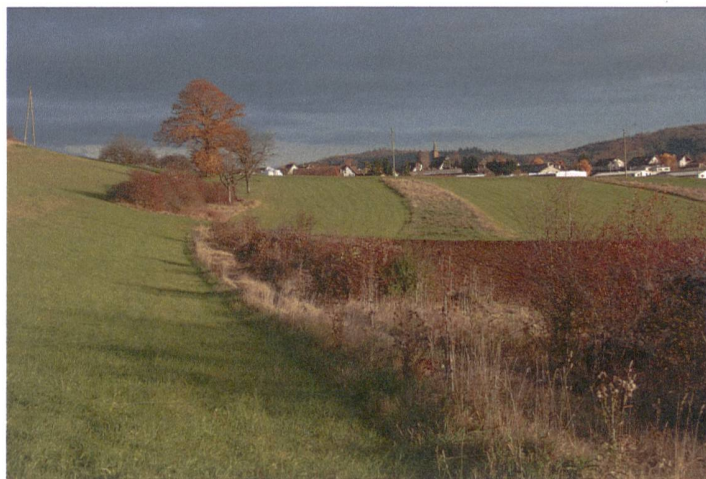
Abb. 3. Diese Landschaft ist mit den Biodiversitätsförderflächen Hecken und Säumen auf Ackerland sehr gut vernetzt.