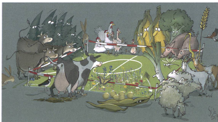
NOVANIMAL Innovationen in der Ernährung" ( www.novanimal.ch ).

Mehr als Landwirtschaft! In der Debatte um Effizienzsteigerung und Technologisierung als Antwort auf wirtschaftlichen Druck und ausländische Konkurrenz gehen die sozialen Dienstleistungen der Landwirtschaft vergessen. Viele Familienbetriebe wären ohne innovative Nischenbewirtschaftung, Zusatzeinkünfte aus «paralandwirtschaftlichen» Tätigkeiten und geeigneten Erwerbskombinationen nicht überlebensfähig. Dies zeigt, dass die Resilienz von Betrieben mit einer innovativen Gestaltung sozialer Dienstleistungen gefördert werden kann. Manche Betriebe erbringen bereits heute Leistungen in den Bereichen Betreuung, Bildung, Agrotourismus, Eventorganisation oder soziale Vermarktungs- und Verarbeitungsformen. Bis anhin haben diese Leistungen wenig Anerkennung gefunden. Das Projekt untersucht, welche Bedeutung soziale Dienstleistungen für die Resilienz von Landwirtschaftsbetrieben haben und ermöglicht so eine objektive Debatte über den Bedarf solcher Leistungen neben der Nahrungsmittelproduktion.