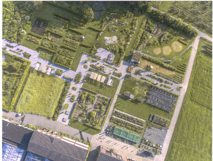
Luftaufnahme Gärten im Grüental, Institut für Umwelt und Natürliche Ressourcen

Für den Bildungsbereich heisst das: Junge Menschen müssen nicht nur befähigt werden, Lebensmittel anzubauen und zu produzieren, sondern auch, unternehmerisch aktiv zu werden. Die Bedeutung neuer, innovativer Businessideen, von Networking und Vermarktung nimmt zu. Unternehmer werden in Zukunft vermehrt Verantwortung für den gesamten Produktprozess übernehmen und diesbezüglich Transparenz und Vertrauen bei ihren Kunden schaffen müssen. Eine entsprechende Sensibilisierung gehört damit in die Ausbildung potenzieller Agrofood-Unternehmerinnen und -Unternehmer.