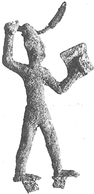
Abbildung 1. Gott aus Megiddo. 6

grösser als 15 cm, nur wenige Fragmente lassen auf grössere (bis menschengrosse) Statuen schliessen. Die Abb. 1 soll wenigstens einen Eindruck einem solchen Kultbild vermitteln: