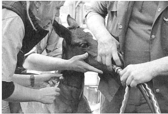
Vorbereitung eines Fohlens für die Allgemeinanästhesie.

Die Abteilung für Anästhesiologie ist eine Tierartenübergreifende Abteilung, die am Tierspital in Zürich zuständig ist für Anästhesien von Hunden, Katzen, Pferden, Kühen, kleinen Wiederkäuern, Schweinen und vereinzelt auch Zootieren. Bei der perioperativen