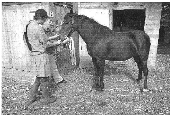
Das Setzen der Nasenschlundsonde braucht Gespür.

mit einer adäquaten Stellung in der Gesellschaft, wofür eine zufriedene Arbeitnehmerschaft und eine gesunde Arbeitgeberschaft Grundlage sind. Die Arbeitgeber wollen eine gute Arbeitsleistung, welche mit Motivation erbracht wird. Dazu benötigen die Arbeitnehmer die Abdeckung ihrer Bedürfnisse (Lohn), ein gutes Arbeitsklima, interessante Arbeit, Wertschätzung und Weiterbildung 21 , die den heutigen gesellschaftlichen Gegebenheiten entsprechen.