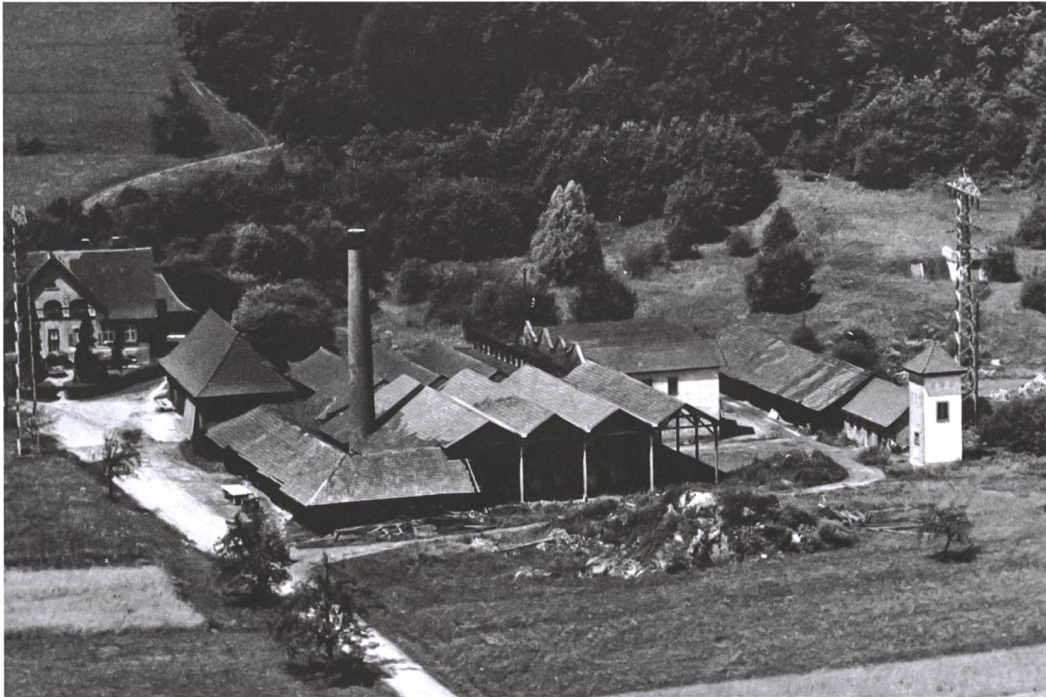
Abb. 4 Die Grunholzer Ziegelei mit dem Wohnhaus im Hintergrund. Die Aufnahme stammt von 1955, als die Halle in der Mitte gerade neu gebaut war, damit die Lastwagen nicht mehr auf der Strasse beladen werden mussten. Hinter dem Transformator die Wohnungen der italienischen Arbeiter.