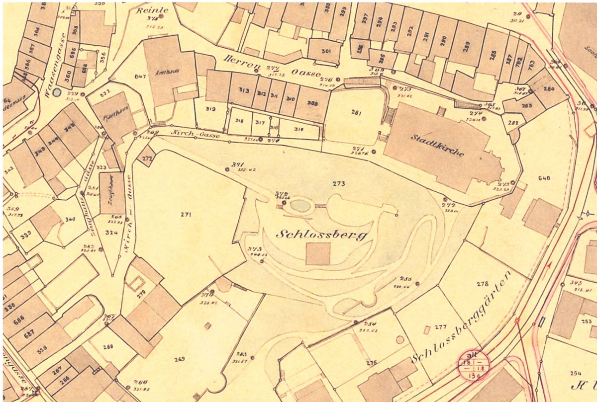
Abb. 11 Ausschnitt aus dem Bebauungsplan von 1909 mit dem etwa zehn Jahre zuvor (1897) neu angelegten Wegsystem des Schlossbergs.