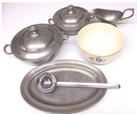
Abb. 6 Geschirrspende für eine Flüchtlingsfamilie in Säckingen.

Zwar konnten Flüchtlinge unter bestimmten Bedingungen im Rahmen der Soforthilfe 35 finanzielle Unterstützung bekommen, doch angesichts der begrenzten Mittel griff dieses Gesetz nur dort, wo die Not am grössten war. So blieben die Flüchtlinge und Heimatvertriebenen zunächst dringend auf die Solidarität und die Spendenbereitschaft der einheimischen Bevölkerung angewiesen. Obst und Gemüse wurden genauso gerne angenommen wie Kleidung, Schuhe und Hausrat. Und auf grosse Dankbarkeit stiessen auch die umfangreichen Spenden der Schweizer Bevölkerung jenseits des Rheins.