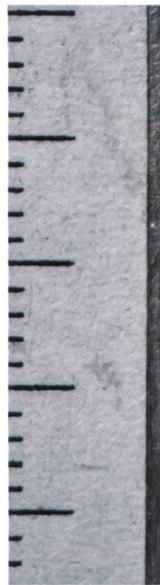
Abb. 10 a/b Münze.