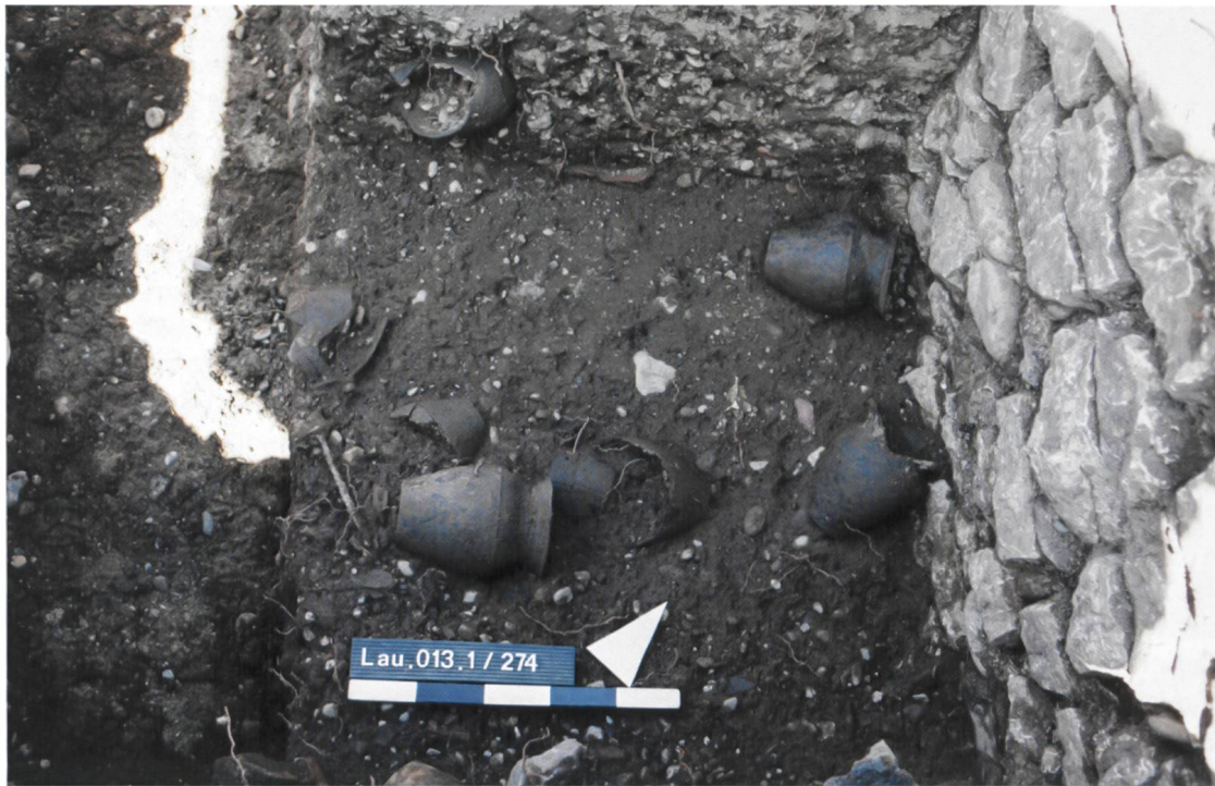
Abb. 2 Einige Töpfe konnten noch vollständig aus dem Keller geborgen werden. Töpfe in Fundlage.

Mauern belegen, dass das Siechenhaus ein Fachwerkgebäude war.