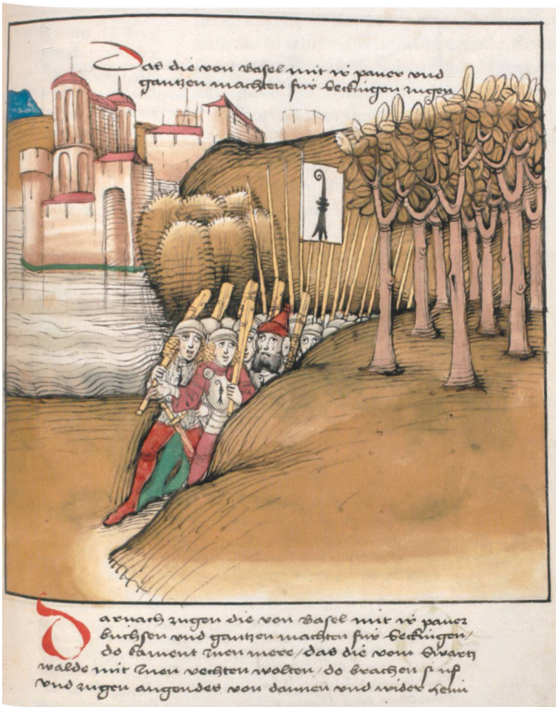
Die Basler ziehen vor Säckingen 1415. (Aus der Spiezer Chronik von Diebold Schilling, Bern, 1484/85. Bern, Burgerbibliothek, Mss.h.h.l.16, f. 292r)

Wichtige Aussagen über das Wirtschaftsleben der Stadt im 15. Jahrhundert liefern zwei Urkunden: Im Februar 1453 wurde das hiesige Thermalbad erstmals urkundlich erwähnt. Dieses war seit dem Mittelalter betrieben worden. Im Jahr 1457 wurde erstmals das Heidenwuhr schriftlich erwähnt. Der im Mittelalter angelegte Kanal sicherte die Wasserversorgung für das Säckinger Gewerbe in der Vorstadt, nördlich der heutigen Bahnlinie. Dort befanden sich fünf Eisenwerke und drei oder vier Getreidemöhlen.