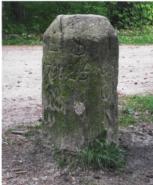
Tafel zum Siebenbannstein.