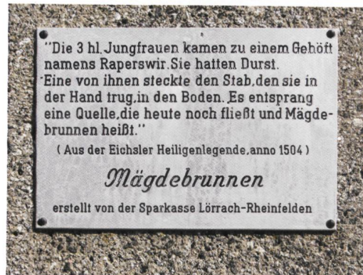
Mägdebrunnen an der Gemarkungsgrenze Adelhausen/Eichsel.