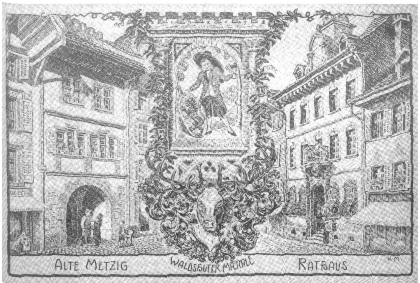
Abb. 2 Waldshut, «Alte Metzsig» (Metzgertörle), erstes Schulgebäude der Gewerbeschule 1837.

Anfangs fand der Unterricht noch im Haus Alte Metzsig (Metzgertörle) in der Kaiserstrasse statt, da die eigentlich vorgesehenen Unterrichtsräume im 1575 erbauten alten Kornhaus beziehungsweise Zunfthaus erst noch hergerichtet werden muss-