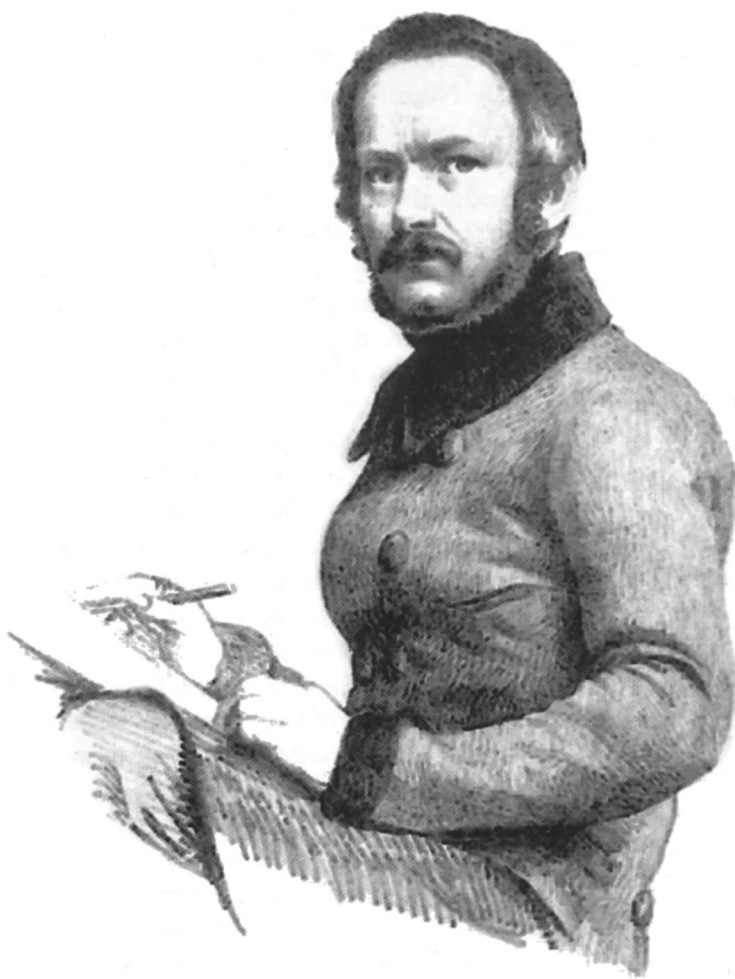
Abb. 1 Erhard Joseph Brenzinger, Selbst- porträt von 1846.

gens eingerichteten Gewerbeschulfonds flossen. Mit Urkunde vom 4. Januar 1837 übereignete unter anderem die Waldshuter Herrenstuben-Gesellschaft ein Kapitalvermögen sowie eine Liegenschaft (Wohnung) im Gesamtwert von 1800 Gulden. Die Wohnung konnte entweder für die Abhaltung des Unterrichts selbst oder zur Unterbringung eines bei der Schule angestellten Lehrers genutzt werden. Damit die edle Stiftung respektive die Stifter selbst nicht in Vergessenheit gerieten, wurde der Gewerbeschule dabei folgende Auflage gemacht: