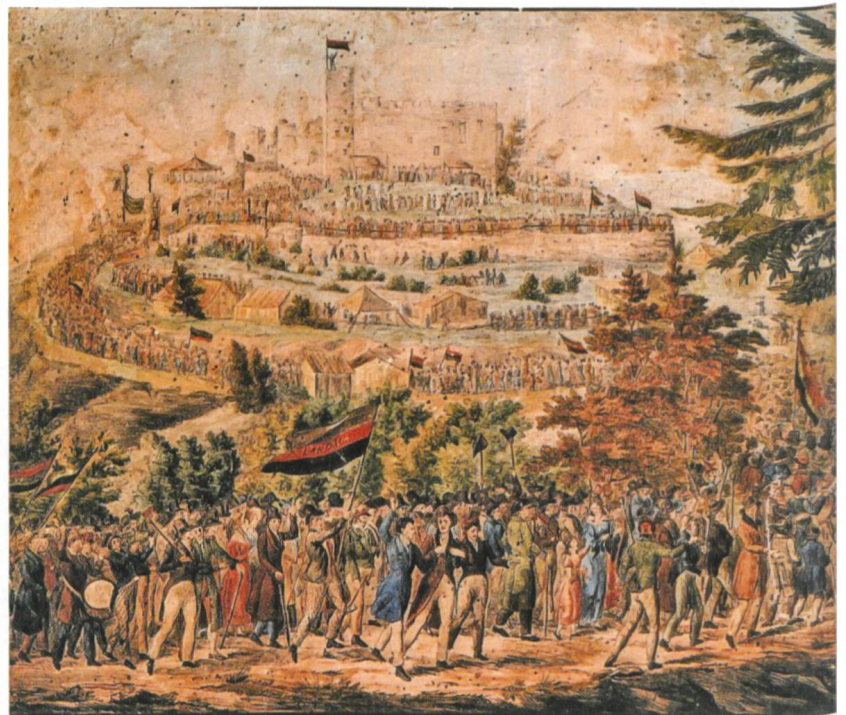
Abb. 3 Erhard Joseph Brenzinger, «Der Zug zum Hambacher Schloss», 1832.

Weit bis in die zweite Hälfte des 20. Jahrhunderts hinein hatte die Textilindustrie in unserer Gegend dominiert. Doch mit der Nutzbarmachung der Wasserkräfte des Rheins und seiner Nebenflüsse um 1900 entstanden nach und nach weitere Industriezweige. Die chemische sowie die metallverarbeitende Industrie prägten zunehmend die hiesige Wirtschaft. Mithin veränderten sich durch die an die Arbeitskräfte gestellten höheren Anforderungen auch die an der Gewerbeschule vermittel-