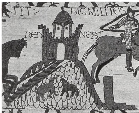
Abb. 4 Darstellung einer Motte auf dem Teppich von Bayeux (F) zwi- schen 1070 und 1082.

Wer die Wehranlage auf dem Herrain erbaute und wem sie als Wohnsitz diente, ist unsicher. Dass sie mit den Grafen von Homberg-Tierstein in Verbindung steht, ist hingegen wahrscheinlich. Seit dem 11. Jahrhundert besass die mächtige Hochadelsfamilie im damaligen Frickgau eine geschlossene Grundherrschaft. In Schupfart verfügte sie später über bedeutenden Besitz, darunter den Kirchenzehnten. 7 Eine Variante wäre daher, dass die Grafen die Wehranlage schon im 11. Jahrhundert erbauten und ihnen nebst den beiden Burgen Alt Homberg und Alt Tierstein als Wohnsitz diente. Eine andere Variante wäre, dass im Zeitraum des 10. bis 12. Jahrhundert ein aus der bäuerlichen Oberschicht aufgestiegener Grossgrundbesitzer aus Eigenantrieb die Befestigung errichtete – einerseits zur Abgrenzung seiner Stellung gegenüber der übrigen Dorfbevölkerung, andererseits zur Manifestierung seiner Besitzungen und Rechte. Dass es sich bei dieser Person um den legendären Hirminger gehandelt haben soll, der laut einer chronikalischen Überlieferung im Jahre 926 im Sisslerfeld die Ungaren überfallen und geschlagen hat, ist reine Spekulation. 8 Dieser Adelige, der dem Stand der so genannten