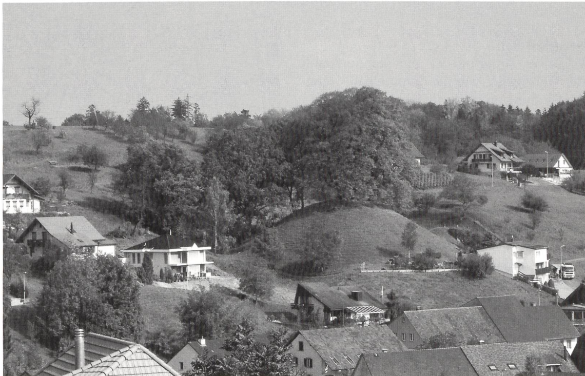
Abb. 1 Schupfart Herrrain: Die Wehranlage von Südwesten.