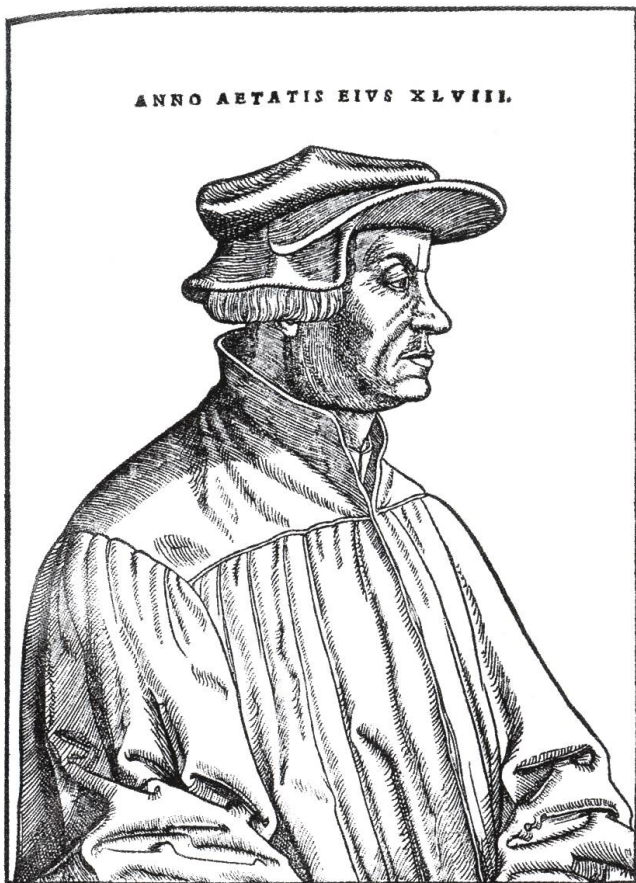
Abb. 4: Der Zürcher Reformator Ulrich Zwingli war Vorbild und Weggefährte Hubmaiers. Der Schritt zum Täufern bedeutete jedoch den Bruch mit Zwingli.

(Bild: Anonymer Holzschnitt 1532; in: Leopold von Ranke: Deutsche Geschichte im Zeitalter der Reformation, Zürich)