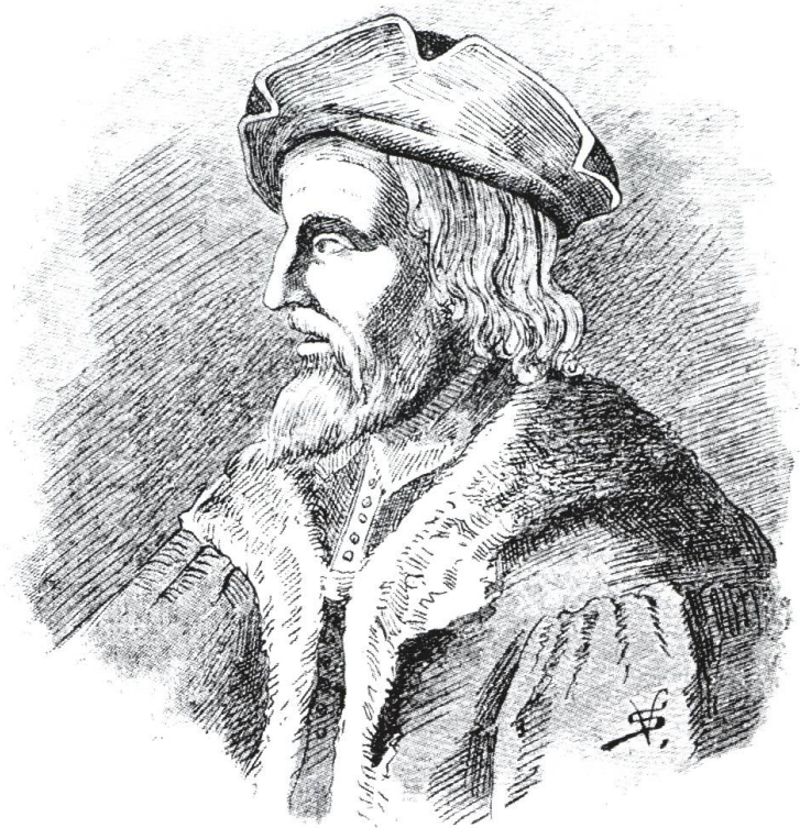
Abb. 3: Balthasar Hubmaier war Pfarrer an der oberen Kirche in Waldshut. Unter seiner Führung bekannte sich die Stadt 1524 zum neuen Glauben. Ein Jahr später wagte er den radikalen Schritt zu einer täuferisch orientierten Reformation. Nach seiner Niederlage musste er fliehen und endete in Wien auf dem Scheiterhaufen.

humanistischen und reformatorischen Zeitgenossen, etwa mit Johannes Ökolampad (1482–1531) in Basel oder mit Ulrich Zwingli (1484–1531) in Zürich (Abb. 4). Im Mai 1523 traf er ein erstes Mal mit Zwingli zusammen und unterhielt sich mit ihm über die folgenreiche Frage der Kindertaufe. Im Oktober des gleichen Jahres beteiligte er sich aktiv an der zweiten Zürcher Disputation, einer wichtigen Wegmarke der dortigen Reformation. Da verlangten die österreichischen Behörden von der Stadt Waldshut, ihren Pfarrer Hubmaier an den Bischof von Konstanz auszuliefern. Die Stadt jedoch weigerte sich und verwies dabei auf ihre Autonomie. Damit wagte ausgerechnet die Stadt Waldshut, die sich bisher durch ihre Treue zum Hause Österreich ausgezeichnet hatte, den Konflikt mit ihrem Landesherrn. Am Pfingstmontag des Jahres 1524 erklärte sich die Bürgerversammlung für den neuen Glauben. Die altgläubigen Geistlichen mussten die Stadt verlassen. Waldshut wurde so die erste reformierte Stadt in österreichischem Gebiet. Ende Oktober zerstörte sie, wie kurz zuvor Zürich, die Bilder in den Kirchen. Österreich konnte vorerst nicht militärisch eingreifen, da seine Kräfte durch an-