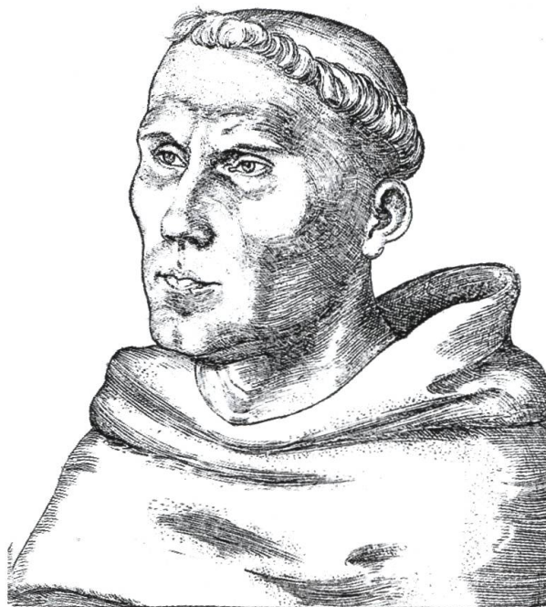
Abb. 1: Martin Luther (1483–1546) Mit seinen Thesen erschütterte der Augustinermönch und Reformator im Oktober 1517 die abendländische Kirche. Die Auswirkungen waren auch bis in die Städte Waldshut DE und Rheinfelden CH zu spüren. (Bild: Kupferstich von Lucas Cranach d. A., 1520; in: Leopold von Ranke: Deutsche Geschichte im Zeitalter der Reformation , Zürich)

Martin Luther (1483–1546) vollzog mit seinen Thesen im Herbst 1517 den Bruch mit der alten Kirche (Abb. 1). Danach liefen die Reformen zusehends auf eine Entscheidung zwischen catholisch und lutherisch hinaus, wenn auch die Grenzen noch lange weit weniger klar waren, als wir uns dies im Nachhinein vorstellen. Der Kampf um diese Entscheidung erschütterte auch die österreichischen Vorlande.