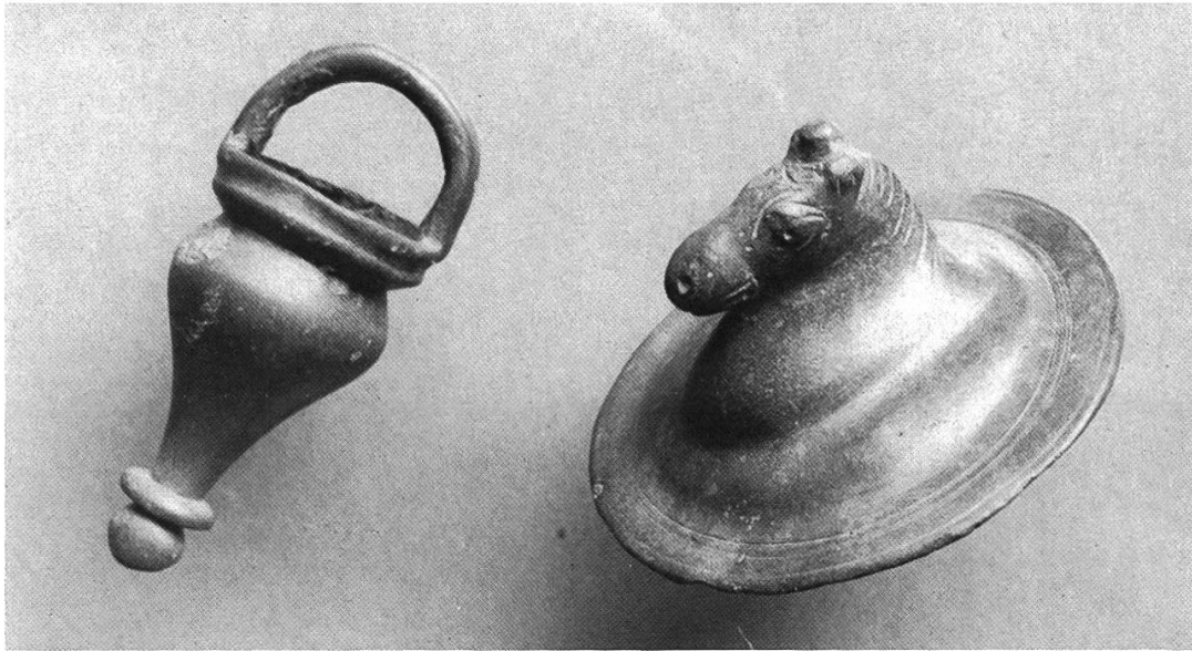
Abb. 4: Römische Gussarbeiten aus Bronze.

Keramik findet, ist dieser Schadenbrand kaum den im 3. Jahrhundert einwandernden Alamannen anzulasten. Ein überhitzter Ofen kann ebenso gut die Ursache dafür gewesen sein, dass uns der Wyhlener Boden diese wertvollen Kleinbronzen römischer Zeit überliefert hat.» 2)