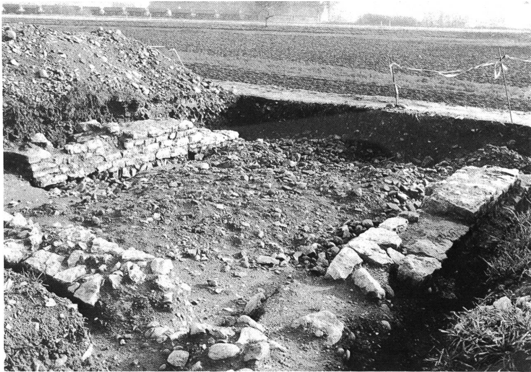
Abb. 6: Das römische Ökonomiegebäude im Beuggener Gewann «Steinacker» nach seiner vollständigen Freilegung. Die Südseite des Baues ist bei den Baggerarbeiten für die Rheinfelder Abwasserleitung zerstört worden.