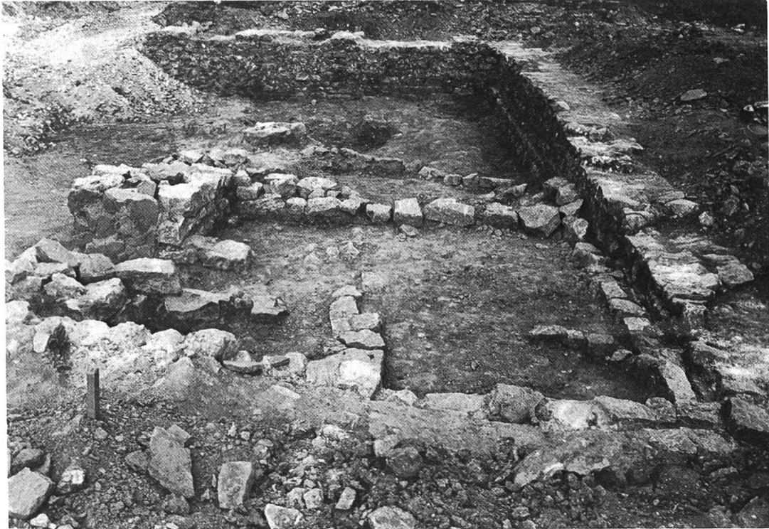
Abb. 2: Der im benachbarten Grundstück freigelegte Bereich des Hauses. Links oben kann man erkennen, dass der in der Strassentrasse liegende Teil bereits wieder mit Kies zugeschüttet ist.

durch den Baggerführer um etwa 30 cm abgetragen worden, so dass nur noch die letzten 3—4 Steinlagen erhalten waren.