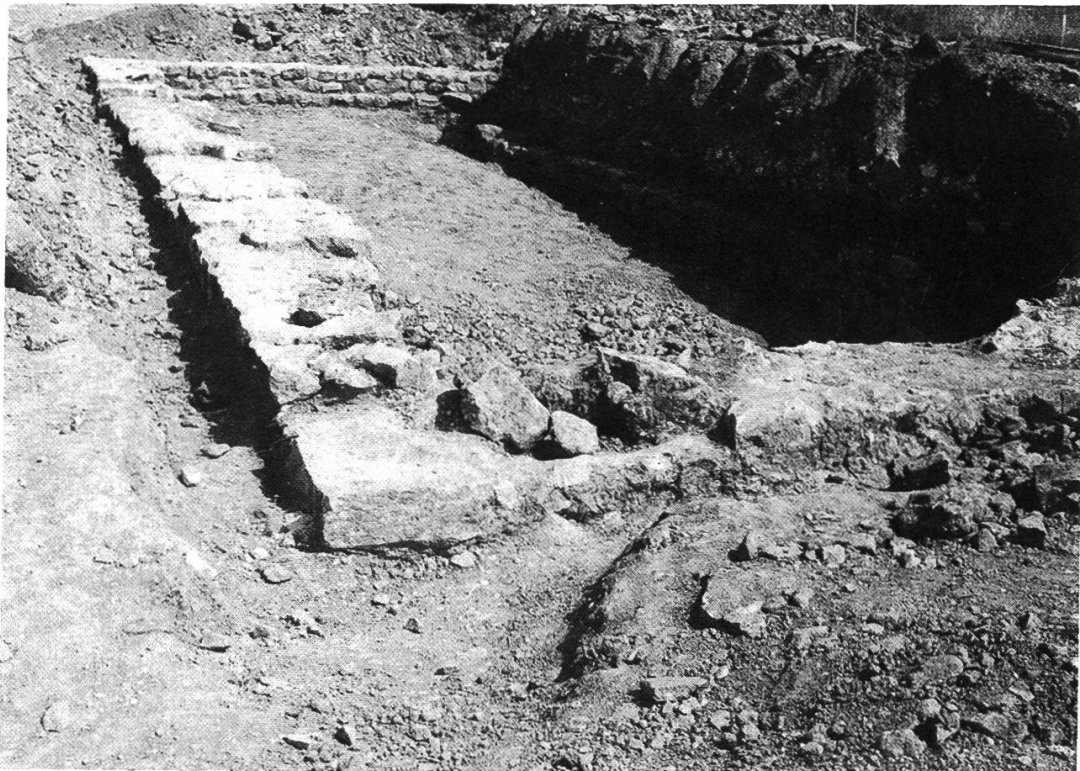
Abb. 1: Der in der Trasse der Heideggerstrasse liegende Gebäudeteil. Die im Vordergrund sichtbare beschädigte Stelle zeigt an, wo der Bagger im letzten Augenblick die Mauer getroffen hatte.

In den folgenden zwei Wochen legten wir dann diesen Teil vollständig frei, wobei wir neben zahlreichen Keramikbruchstücken auch einen Kalksteinmörser mit Stössel, ein Querbeil (Dechsel) und ein Messer fanden. Bei unserer Grabung stiessen wir an der südlichen Trassenkante auch auf eine Zwischenmauer, vor der eine grosse Herdstelle angebracht war. Ausserdem stellten wir eine Brandschicht fest, die durch den ganzen freigelegten Teil des Gebäudes verlief, so dass dieses ein gewaltsames Ende gefunden haben muss. Die Mauern dieses Gebäudeteils sind leider