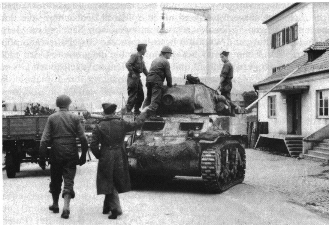
Französische Panzer in Waldshut

Die Rheinkraftwerke an ihrer exponierten Lage gaben zu grossen Sorgen Anlass. Wöchentlich näherten sich die Kriegsfronten Deutschland, und man musste befürchten, dass der Hochrhein in absehbarer Zeit in den Mittelpunkt heftiger kriegerischer Auseinandersetzungen geraten könnte. Im November 1944 fand in Basel eine Besprechung der Verantwortlichen statt, die Schutzmassnahmen für die Rheinkraftwerke im Falle von Bombardierungen erörtern. Eine Kommission wurde gebildet, die die erforderlichen Massnahmen zu erarbeiten hatte. Das Resultat waren ein Verbindungssystem für den sogenannten Werk- und Wasseralarm und Vorschriften für die im Alarmfall zu treffenden Massnahmen. Hinzu kamen später Anordnungen zur Verhütung einer willkürlichen Öffnung der Stauwehre durch die Deutschen, die damit eine künstliche Hochwasserwelle im Falle alliierter Rheinübersetzungsaktionen hätten erzeugen können. 17