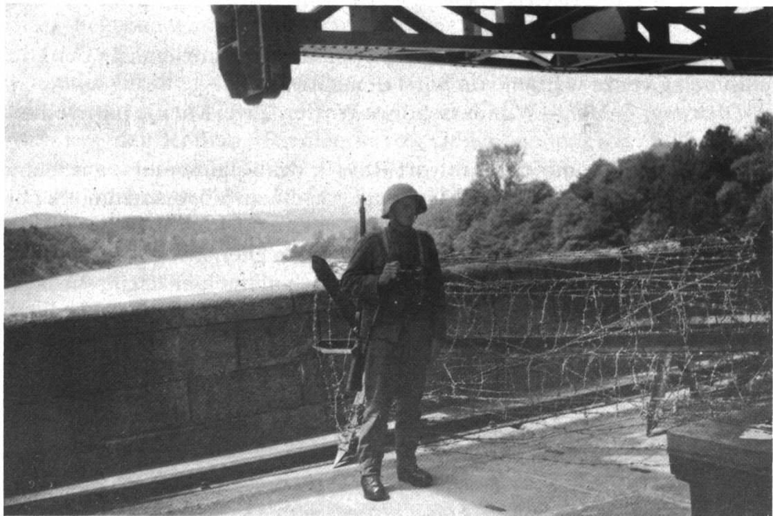
Wacheschieben, Kraftwerk Laufenburg

Der Liberalismus brachte den Gedanken der persönlichen Freiheit, ohne die ein menschenwürdiges Dasein nicht möglich ist. Der Sozialismus setzte die nötigen Schranken, die verhindern, dass Freiheit in Zügellosigkeit ausartet. Wahre Freiheit, die bindet und verpflichtet, ist nur in einem liberalen Sozialismus möglich. – Dass die Familie die Grundla-