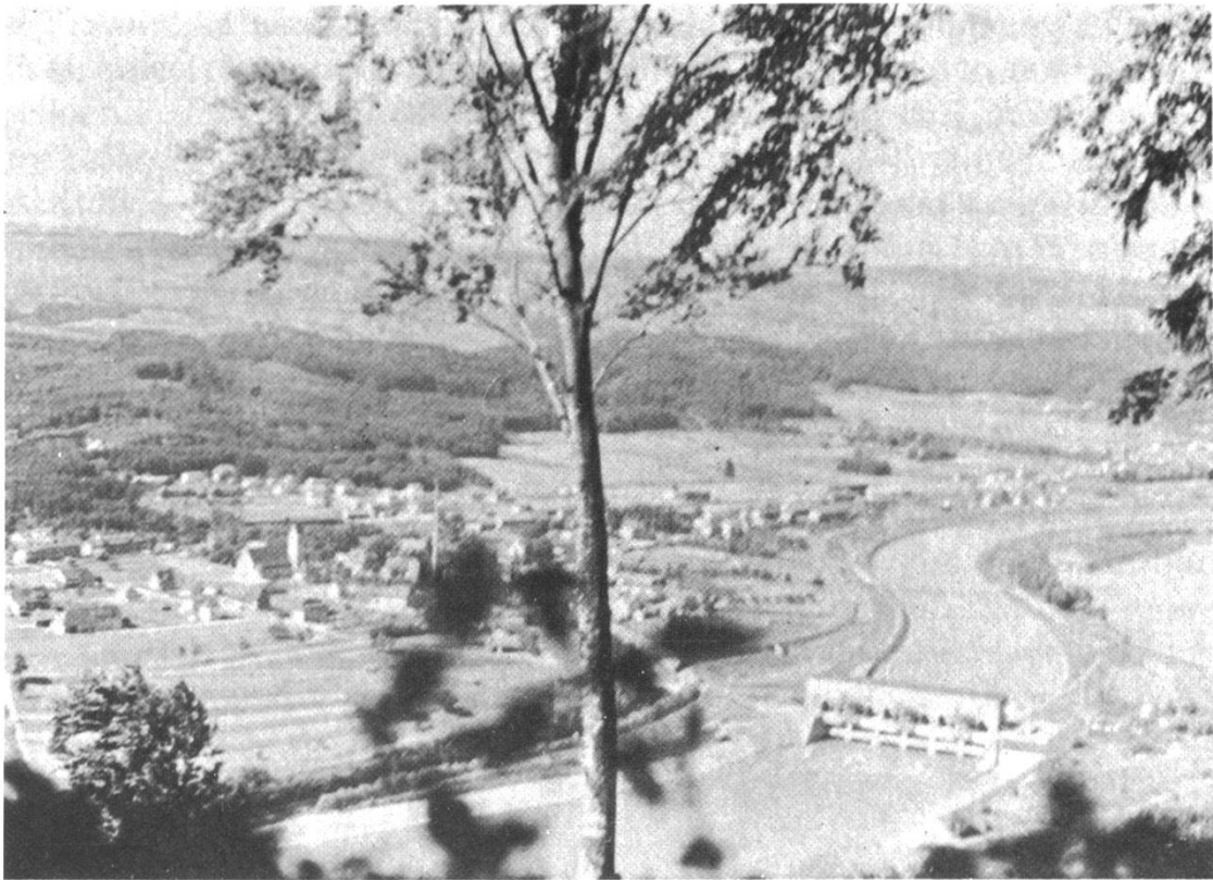
Ausblick vom Beob Posten «Kahlschlag» auf Albbruck

Am Morgen vernahmen wir im Radio, dass Deutschland Polen angreife. Am 3. September schrieb ich meinen Eltern darüber: «Obwohl wir alle das Losbrechen des Kampfes erwartet hatten, glaubten wir doch nie ganz an den Krieg, hofften insgeheim immer noch auf eine friedliche Lösung, und wir waren deshalb niedergeschlagen, aber nur für kurze Zeit.»