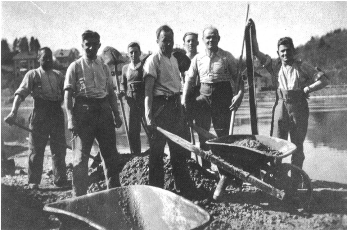
Stellungsbau am Rhein

der gesamten europäischen Politik liegend angesehen wurde, aufrechterhalten und wahrnehmen werde.»