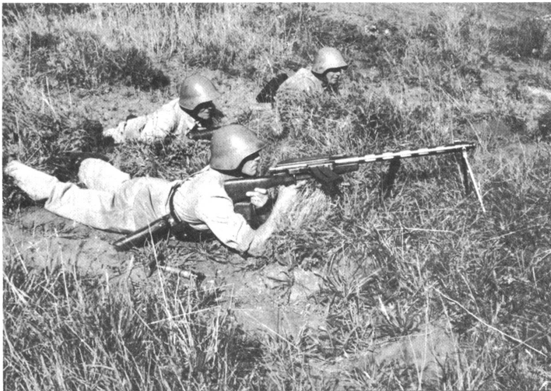
Ausbildung am Lmg

Sehr bald wurden die ersten kriegswirtschaftlichen Massnahmen getroffen. So wird in der zeitgenössischen Presse bereits am 4. September über den Bundesratsbeschluss betr. die Kosten der Lebenshaltung und den Schutz der regulären Marktversorgung berichtet. Alsdann wird am 8. September der Verkehr mit Motorfahrzeugen an Sonn- und Feiertagen