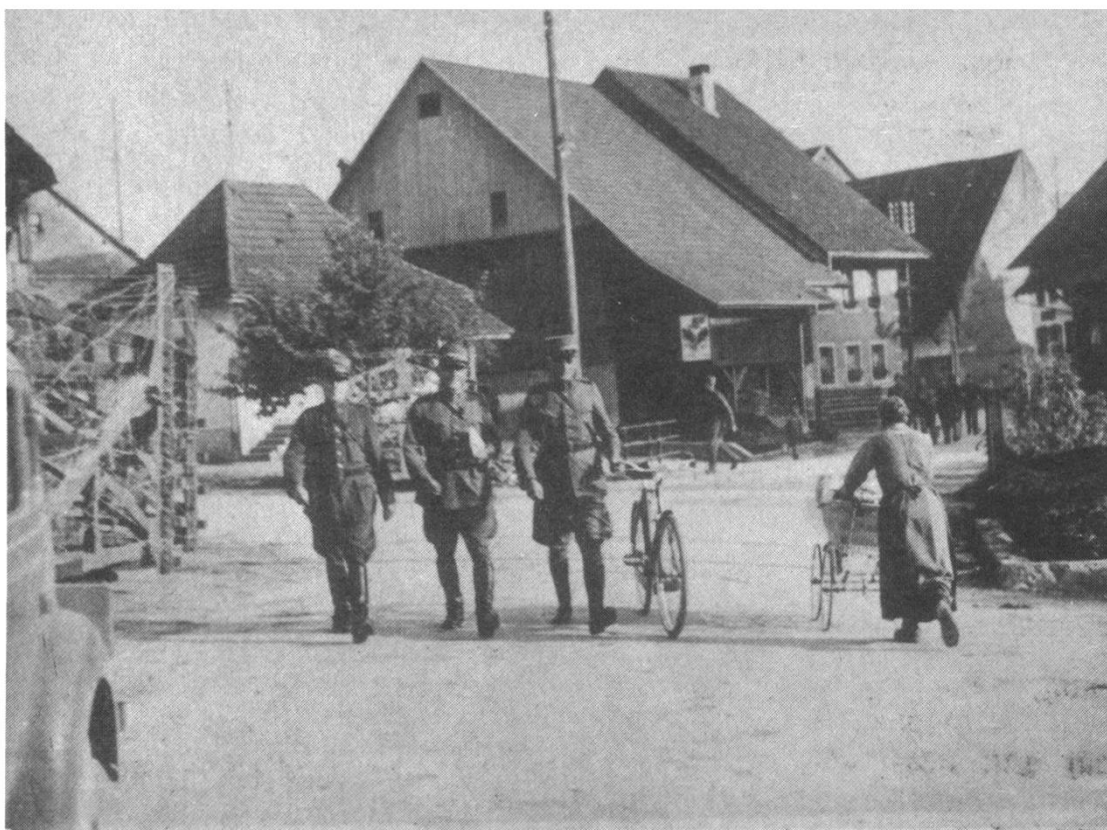
Kaisten 1940, Alltag im Dorf

Recht, kann doch dieses Dorf die Kaisterbergstrasse nach Frick und die Strasse über Ittenthal nach Hornussen verriegeln).