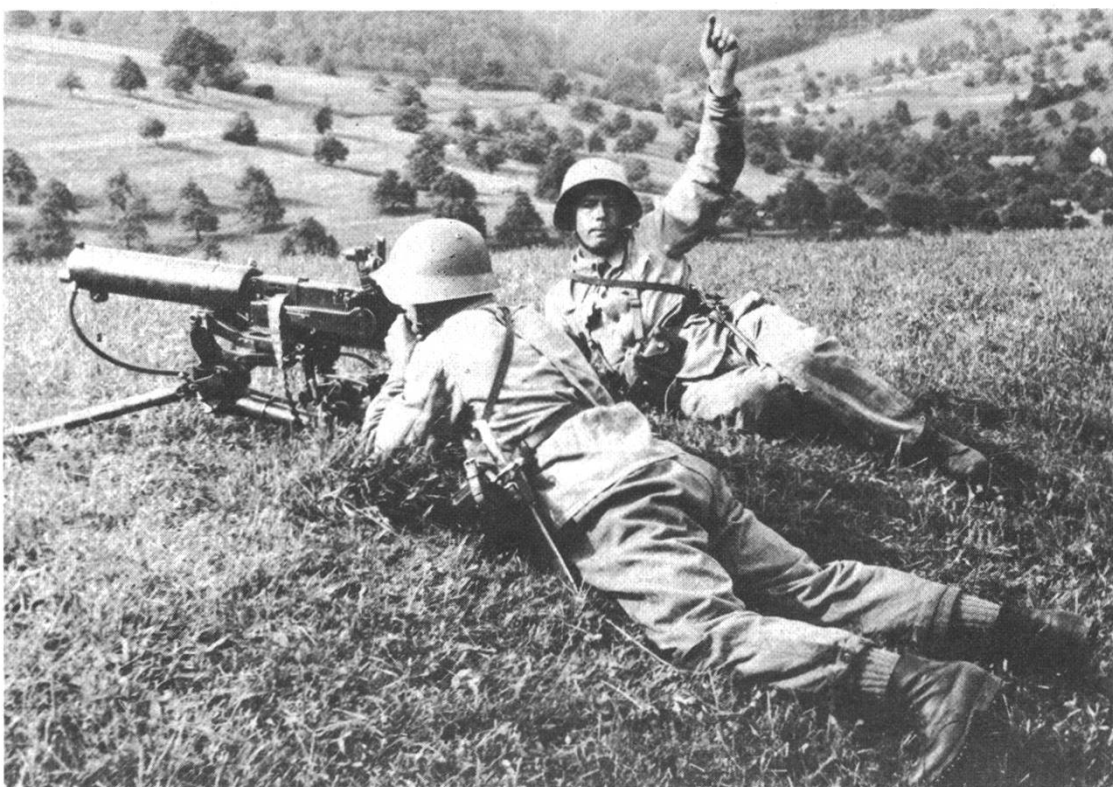
Ausbildung am Mg

«Inzwischen ist der militärische Alltag bei uns eingekehrt. Frühe Tagewacht am nebligen, kühlen Herbstmorgen, Gefechtsausbildung in der Hitze des Mittags, Soldatenschule, Taktschritt, Ausbildung an den neuen Waffen und nicht zuletzt der innere Dienst, all das verlangt den ganzen Einsatz unserer oft nicht mehr dienstgewohnten Landwehrmänner. Was mich aber ganz besonders freut, ist der ausgezeichnete Geist der Mannschaft und Offiziere. Gerade weil der Aktivdienst stark vom Wiederholungsbetrieb absticht, begreift heute der letzte Mann, worum es geht, näm-