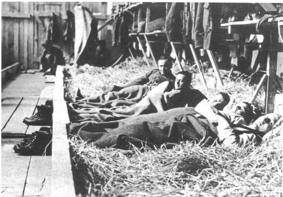
Turnhallen, Scheunen und Wirtschaftssäle dienten als Unterkünfte.