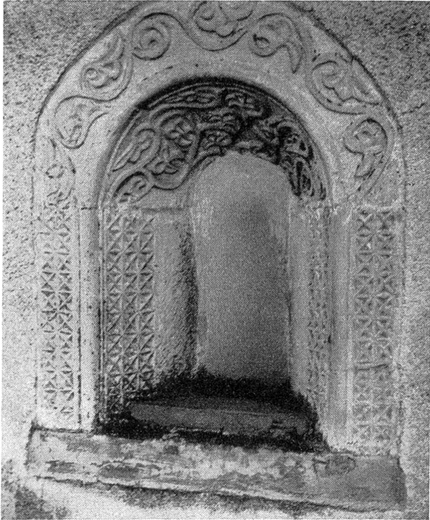
Romanische Nische an der St. Ursulakapelle in Münchwilen. Höhe total 100 cm.