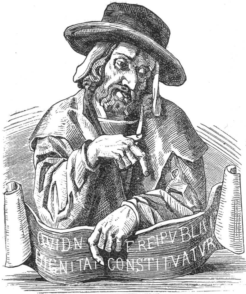
Prophet, hölzernes Bild im Großrathssaale.

Der Bau von 1608 und die daran sich knüpfende innere Ausschmückung des Rathhauses gab Anlaß, auf größere Ordnung und Abstellung verschiedener Mißstände im Hofe des Hauses bedacht zu sein. Um die Gemälde zu schonen, wurden die Harzpfannen an der Rathsstege durch eine Laterne ersetzt. Um „allerley Gefindlin, als Tauner, Landstreicher, welsche Maurer Handwerksgeßellen, Lieder- und andere Krämer, welche mit Ops und Anderem viel Unrath verursachten, und die Buben, so sich Spielens und allerley Muthwillens anmaßen,“ vom Rathhause fern halten zu können, versah man die drei Bogen gegen den Markt mit eisernen Gitterthoren. Die in der Vorhalle beiderseits stehenden Kramhäuslein wurden beseitigt, in der Meinung, daß „an deren Statt denkwürdige Historien gemalt werden könnten.“ Die denkwürdigen Historien wurden auch wirklich sogleich nachher an diese Wände gemalt: Bock's Bilder, Josaphat und Herodes.