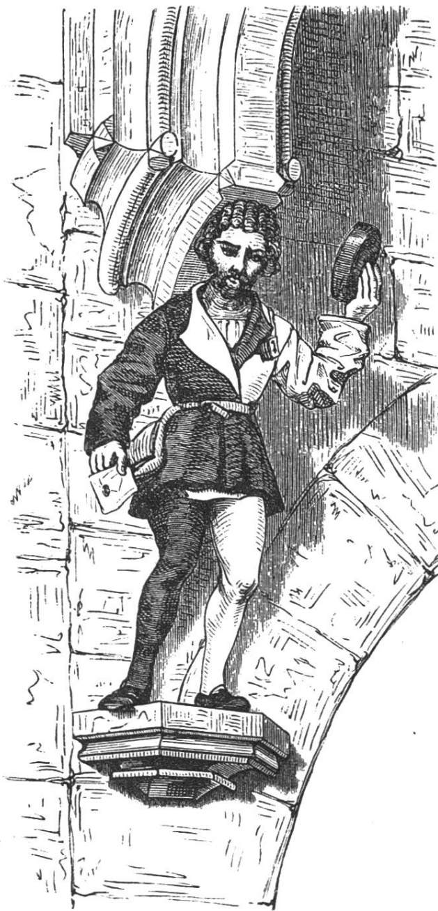
Der Rathsbote am Eingang des Hinterhauses.

Im Jahr 1824 begann eine Restauration des Rathhauses, welche das Gebäude, das bis auf diese Zeit noch die mittelalterliche