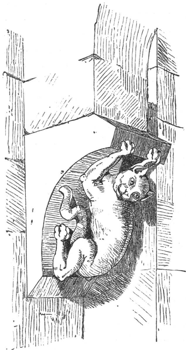
Konsole in der vorderen Kanzlei des Rathhauses.

Der Bau wurde 1504 mit der Niederlegung des alten Vorderhauses begonnen. Im Dezember des genannten Jahres begannen die Stein-