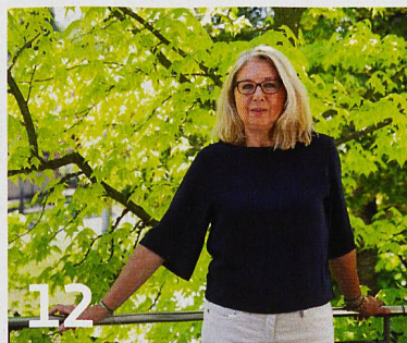
«Grosseltern sind Vorbilder», sagt Professorin Pasqualina Perrig-Chiello.

Die Rolle der heutigen Grosseltern ist anspruchsvoller und intensiver geworden. Gleichzeitig ist aber auch die Wertschätzung der in aller Regel unbezahlten Betreuungsarbeit gestiegen.