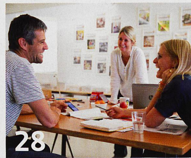
Ein Blick hinter die Kulissen des «Grosseltern»-Magazins.