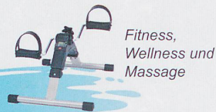
Fitness, Wellness und Massage