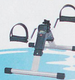
Fitness, Wellness und Massage