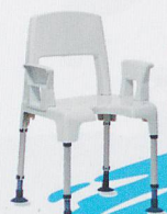
Hilfsmittel für Bad, WC und Dusche