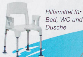
Hilfsmittel für Bad, WC und Dusche