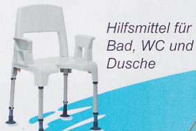
Hilfsmittel für Bad, WC und Dusche