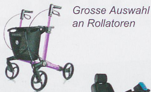
Grosse Auswahl an Rollatoren