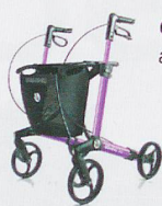
Grosse Auswahl an Rollatoren