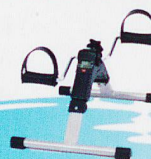
Fitness, Wellness und Massage