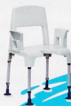
Hilfsmittel für Bad, WC und Dusche