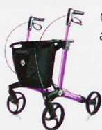
Grosse Auswahl an Rollatoren