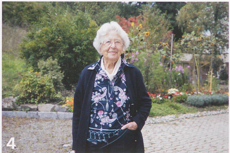
Die Frage nach dem Sinn des Lebens stellt sich angesichts des nahen Endes gerade älteren Menschen in vermehrtem Masse.