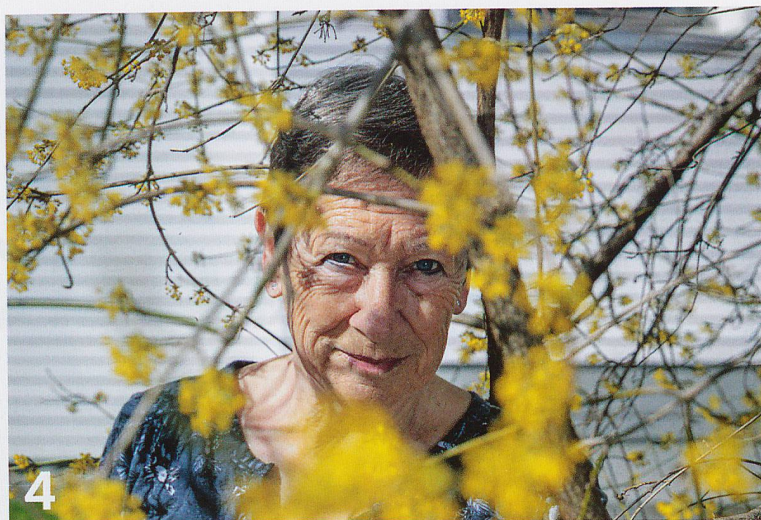
Medizin ohne Nebenwirkungen: Der Aufenthalt in der Natur macht glücklich und erhält gesund - vor allem auch im Alter.