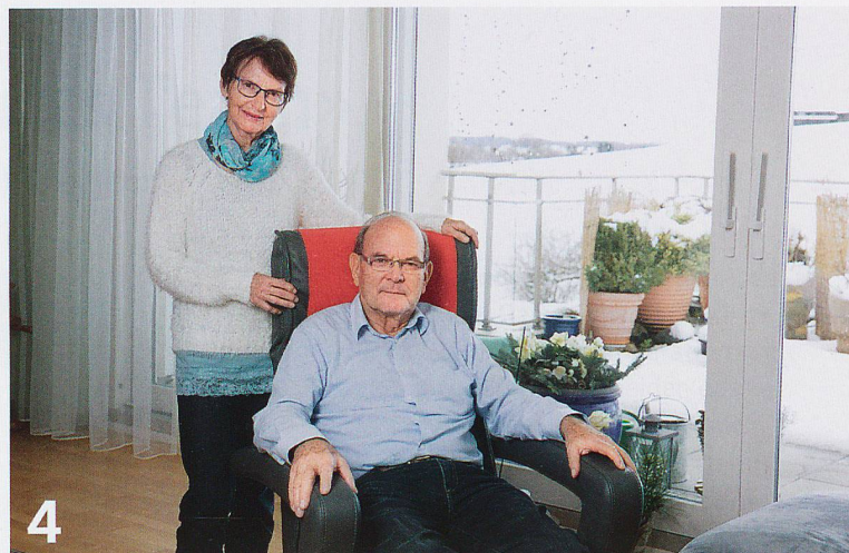
So lange wie möglich selbstständig zu Hause leben. Das wünschen sich viele Menschen. Angehörige und spitalexterne Dienste machen dies möglich.