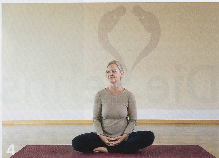
4 Mit der Vorstellung eines Jenseits verbindet sich die Suche nach dem Sinn des Lebens. Menschen mit Nahtoderfahrungen berichten.