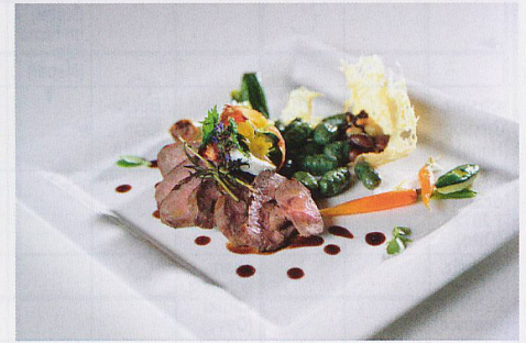
«Stump's Alpenrose», ein besonderer Ort zwischen Seen, Alpweiden und Bergen.