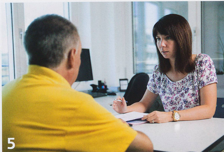
5 Seit 100 Jahren unterstützt Pro Senectute Kanton Zürich ältere Menschen und deren Angehörige mit vielfältigen Dienstleistungen.