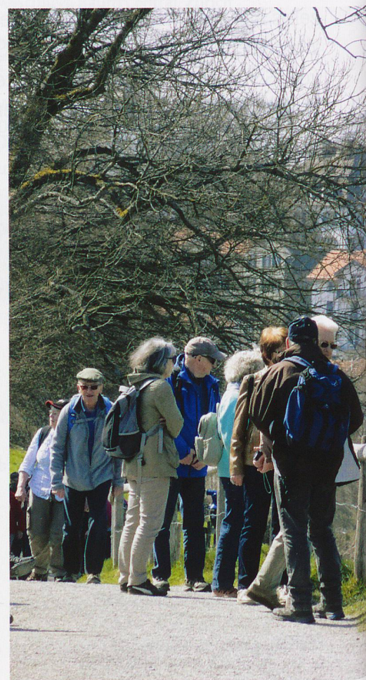
Die Wandergruppe auf dem Weg zu den «Drei Weieren».