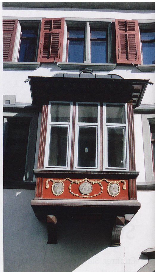
111 Erker mit individueller Geschichte gibt es in der Altstadt von St. Gallen.