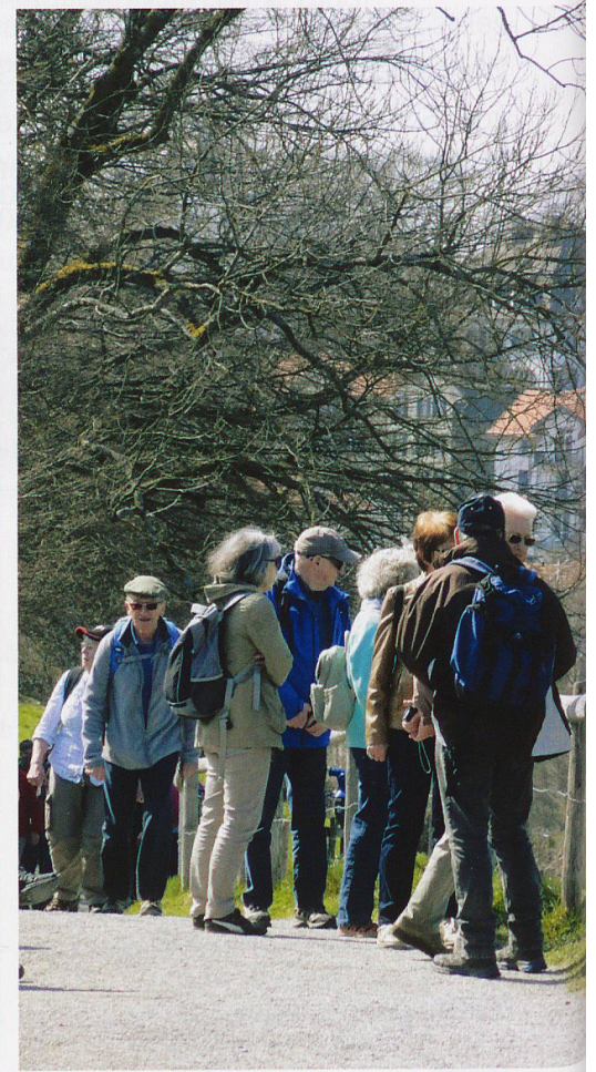
Die Wandergruppe auf dem Weg zu den «Drei Weieren».