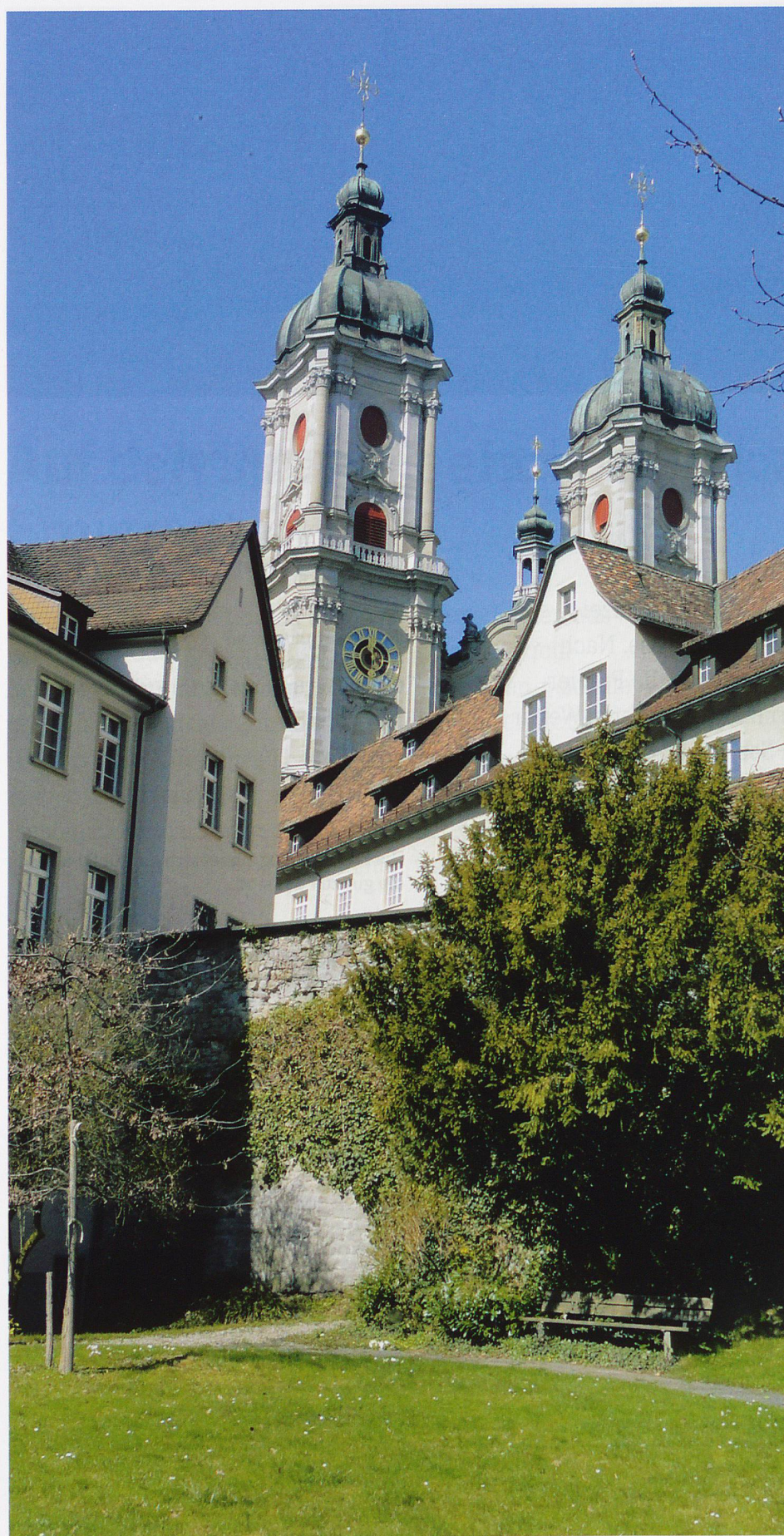
Ungewohnter Blick auf die Kathedrale von St. Gallen. Unweit von hier befindet sich die Station Mühleggbahn.