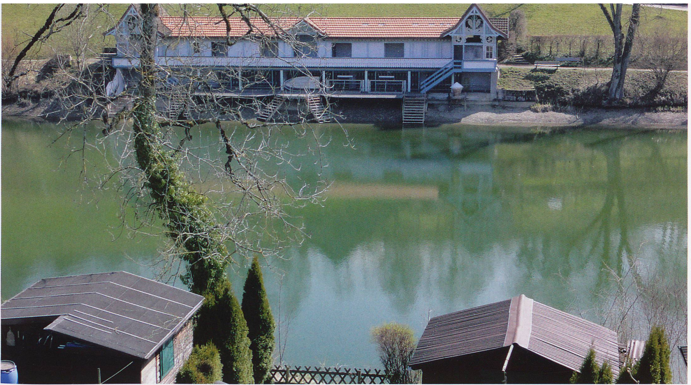
Das Gebiet der «Drei Weieren» oberhalb der Gallusstadt auf dem Freudenberg ist das Naherholungsgebiet schlechthin. An warmen Tagen lässt sich hier baden und geniessen.