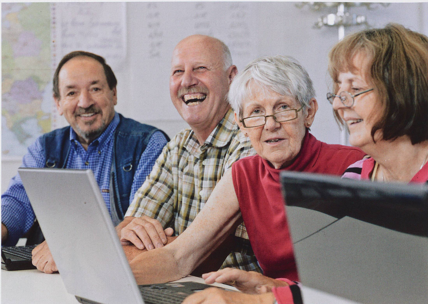
Die Partnerschaft mit der Klubschule Migros bringt viele Vorteile für unsere Kursteilnehmenden.