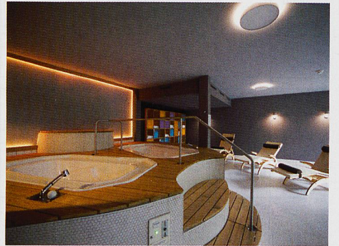
Lädt zum gemütlichen Ausspannen und Geniessen ein: Hotel Artos in Interlaken.