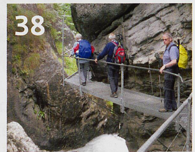
38 Auf der Lötschberg-Südrampe: Visit wandert mit einer Seniorengruppe den Suonen entlang.