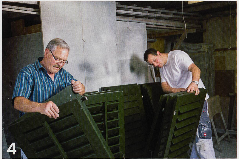
4 Lebenserfahrung entsteht aus der Fähigkeit, Erkenntnisse aus Vergangemem mit der Offenheit für Neues zu verbinden. Vier Beispiele, wie ältere Menschen Erfahrungen an jüngere Leute weitergeben.