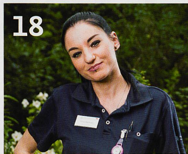
18 Pflegende erzählen, was sie von den Betagten an Lebenserfahrung und Erlebtem mitbekommen.