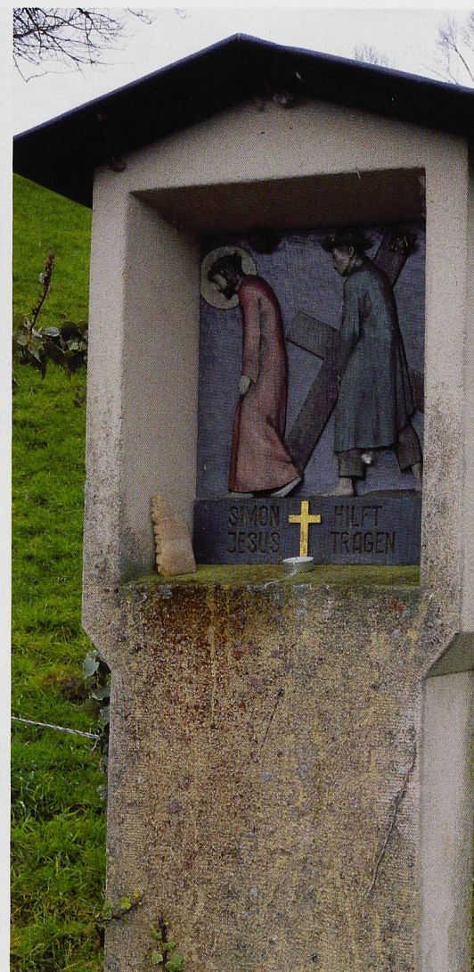
Dem Böschkanal entlang (Bild oben) geht es vorbei an den Teichen «Widen» (links) hinauf zum Benker Büchel mit dem Kreuzweg Jesu (rechts).