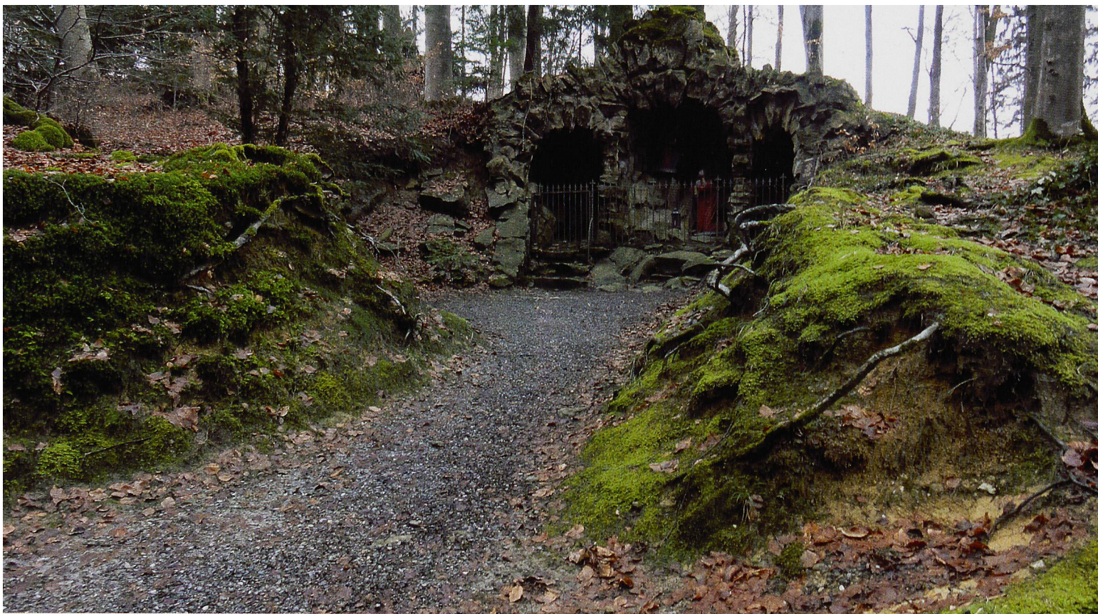
Eine der verschiedenen Grotten auf dem Benker Büchel ist die «Lourdesgrotte».

VON UZNACH NACH BENKEN Die Wandergruppe Schwerzenbach begibt sich auf die Spuren der Reformation und pilgert hinauf zu Maria Bildstein auf den Benkner Büchel. Eine Wanderung zwischen den Religionen.