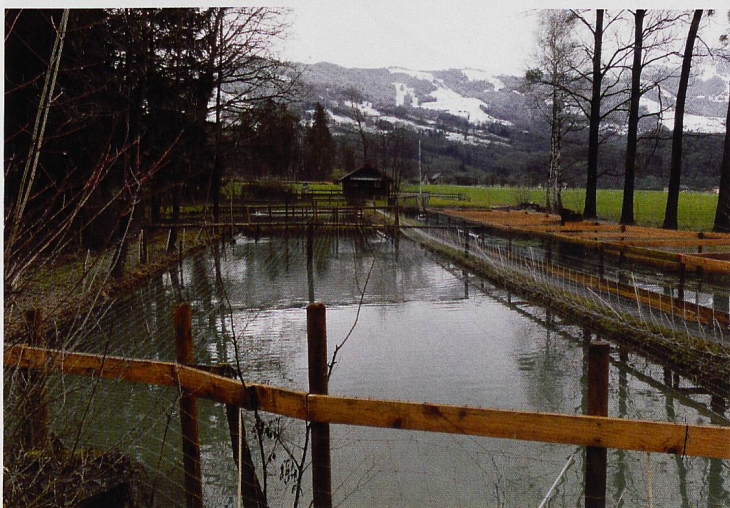
Dem Böschkanal entlang (Bild oben) geht es vorbei an den Teichen «Widen» (links) hinauf zum Benker Büchel mit dem Kreuzweg Jesu (rechts).