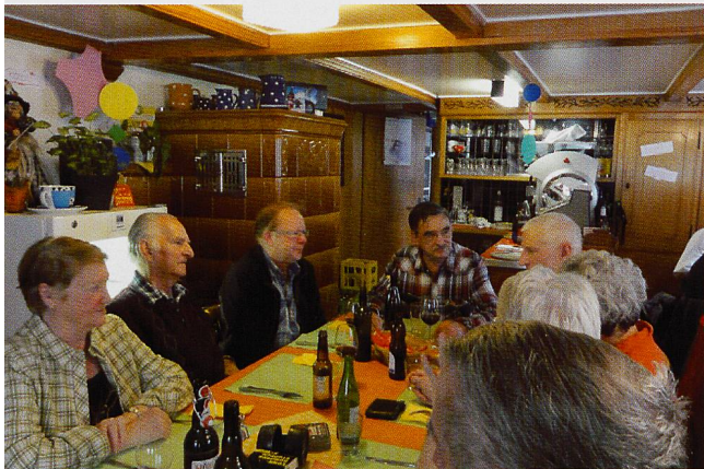
Im Gasthaus zur Kapelle lässt sich bestens rasten und sich austauschen – und notfalls aufwärmen.