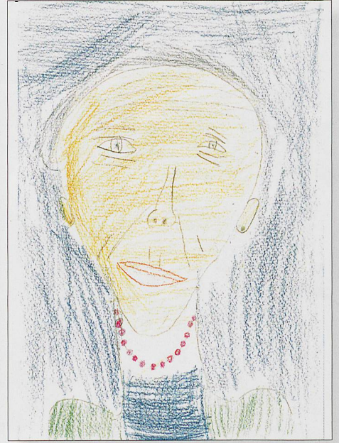
Line (7 Jahre)