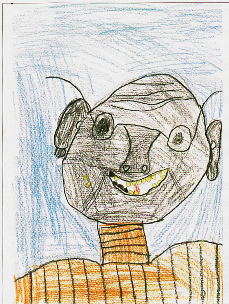
Loris (8 Jahre)