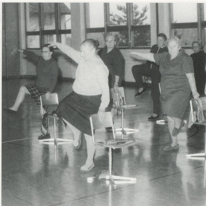
Links: Freud- volles Turnen auf dem Stuhl.