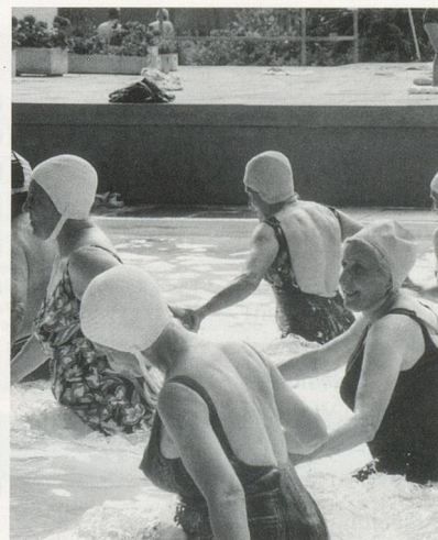
Links, Mitte: Sportfest in Zürich-Fluntern.