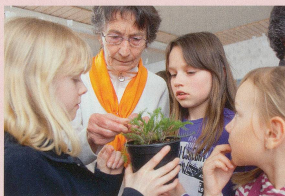
Sehr beliebt: Austausch zwischen Generationen

Grosseltern, die nach Ideen und Unterstützung suchen, was sie zusammen mit andern Senioren mit Enkelkindern machen können, finden Anregungen und Unterstützung auf der folgende Projektplattform: www.intergeneration.ch