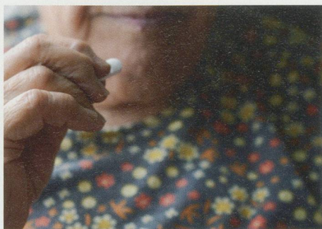
4 Medikamente und Alkohol – gefährliche Seelentröster