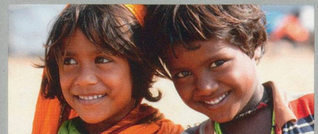
Unvergessliches Indien 19. November – 7. Dezember 2012 / 19 Tage

Arusha – Tarangire – Lake Manyara – Ngorongoro – Serengeti – Stonetown (Zanzibar) – Nordküste Zanzibar pro Person im Doppelzimmer ab CHF 8870.–