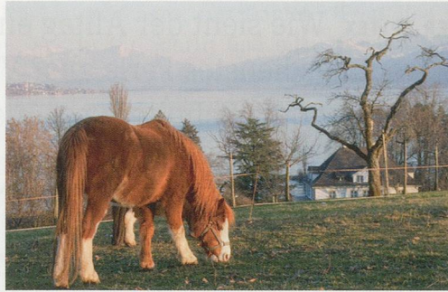
32 Entlang dem Zürichsee zwischen Horgen und Wädenswil.