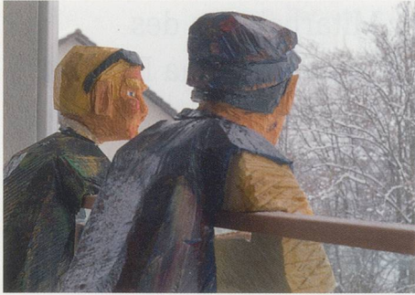
18 Demenzpflege im Krankenhaus Sonnweid in Wetzikon.