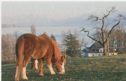
32 Entlang dem Zürichsee zwischen Horgen und Wädenswil.