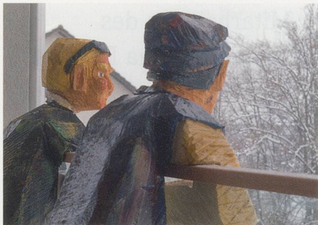
18 Demenzzpflege im Krankenhaus Sonnweid in Wetzikon.