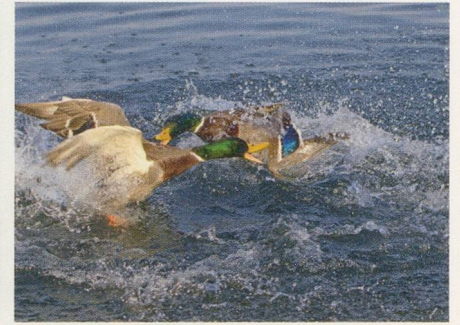
30 Entdecken: entlang der Limmat spazieren.